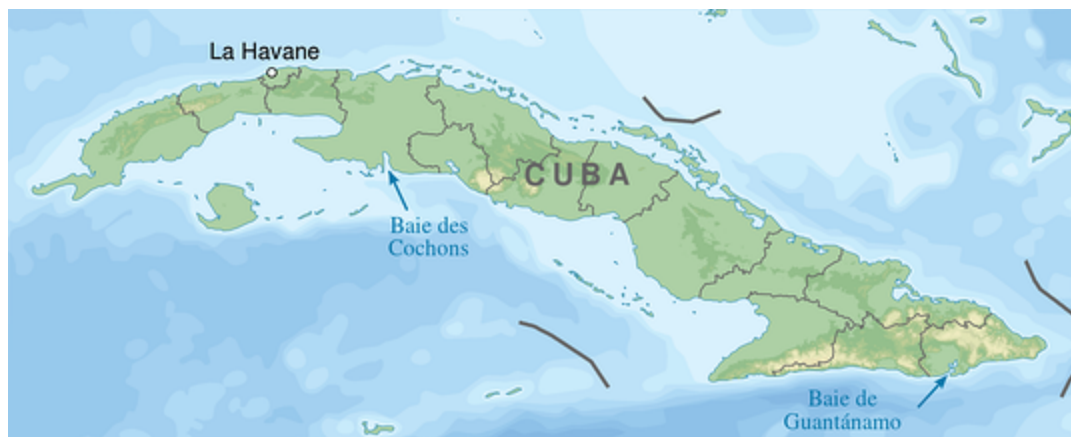
La Baie des Cochons : Sémhur - Wikipedia

En 1961, quelques opposants débarquent dans la Baie des Cochons à Cuba, ce fût une opération soutenue par les Etats-Unis, ces derniers avaient pour objectif de susciter un soulèvement de la population dans le but de détourner la situation. Finalement, cette opération n'aura jamais eu lieu.