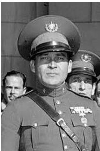
Fulgencio Batista

À la fin des années 50, sous le régime du dictateur Fulgencio Batista, Cuba se porte mal. Le niveau de vie s'est certes amélioré mais les inégalités et la corruption sont encore très largement présentes.