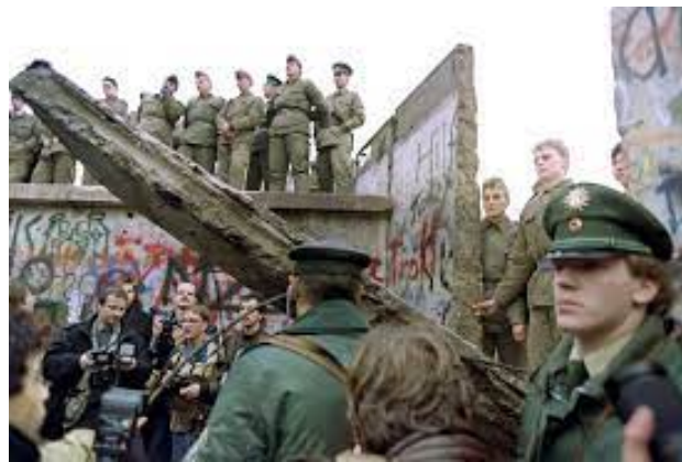
Chute du mur de Berlin, Franceinter.fr

Commençons premièrement avec un rappel historique ; de la chute du mur à la fin de l'URSS. La chute du mur de Berlin marque la fin d'une frontière arbitraire qualifiée de « rideau de fer » par Winston Churchill notamment.