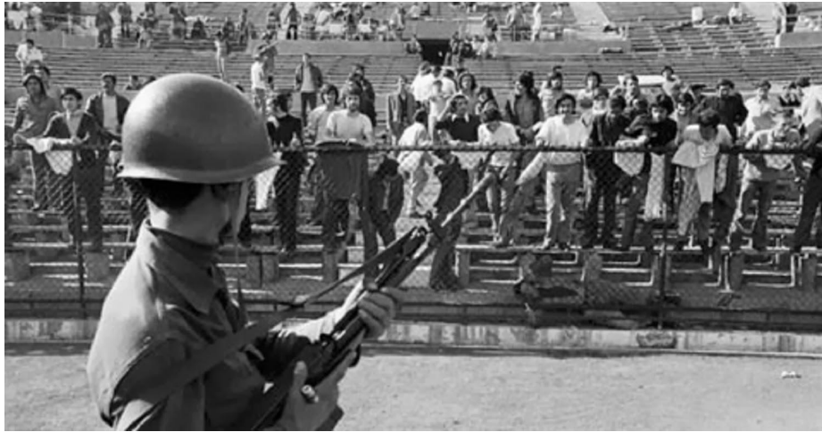
Stade nationale du Chili durant le coup d'Etat en septembre 1973

Nous avons vu dans une première partie la transition politique du Chili au XXe siècle au cœur de la guerre froide, ainsi dans une seconde partie nous allons voir qu'il n'y a pas eu seulement ce pays mais aussi Cuba à la même période.