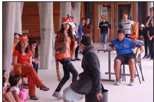
Le Roman de Renart, classe de 5e, 2016

Ces deux opérations sont financées par le Conseil Départemental des Alpes de Haute-Provence.